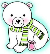
こまめに消してね!